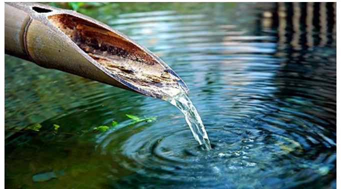
L'eau de source vive, la meilleure eau de santé!

Effectivement, en bouche, la différence de sensation est flagrante : l'eau, toute en douceur, enrobe la langue et semble glisser toute seule au fond de la gorge. L'organisme en redemande. « On veut nous faire croire qu'une eau