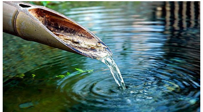
L'eau de source vive, la meilleure eau de santé!

Effectivement, en bouche, la différence de sensation est flagrante : l'eau, toute en douceur, enrobe la langue et semble glisser toute seule au fond de la gorge. L'organisme en redemande. « On veut nous faire croire qu'une eau